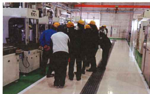
洗浄技術セミナー

洗浄技術や環境規制等の情報を中心とした「最新情報講演」、「JICCの活動紹介」や「優秀新製品賞の紹介と名刺交換」などを通じて、商社、販売店の皆様の業務に役立つ内容をいち早く伝えます。